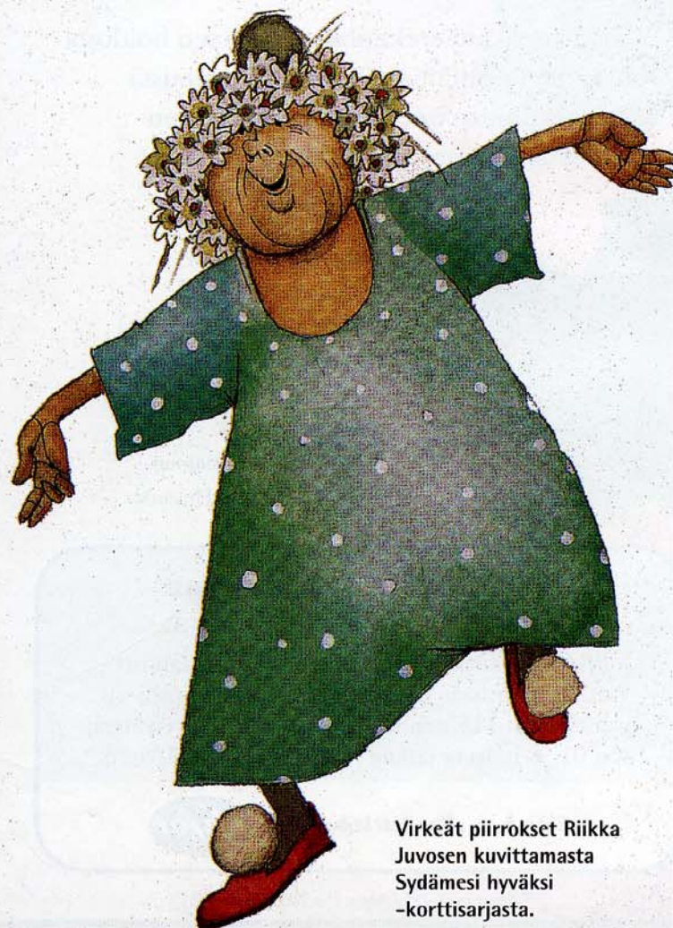
Virkeät piirroksat Riikka Juvosen kuvittamasta Sydämesi hyväksi -korttisarjasta.